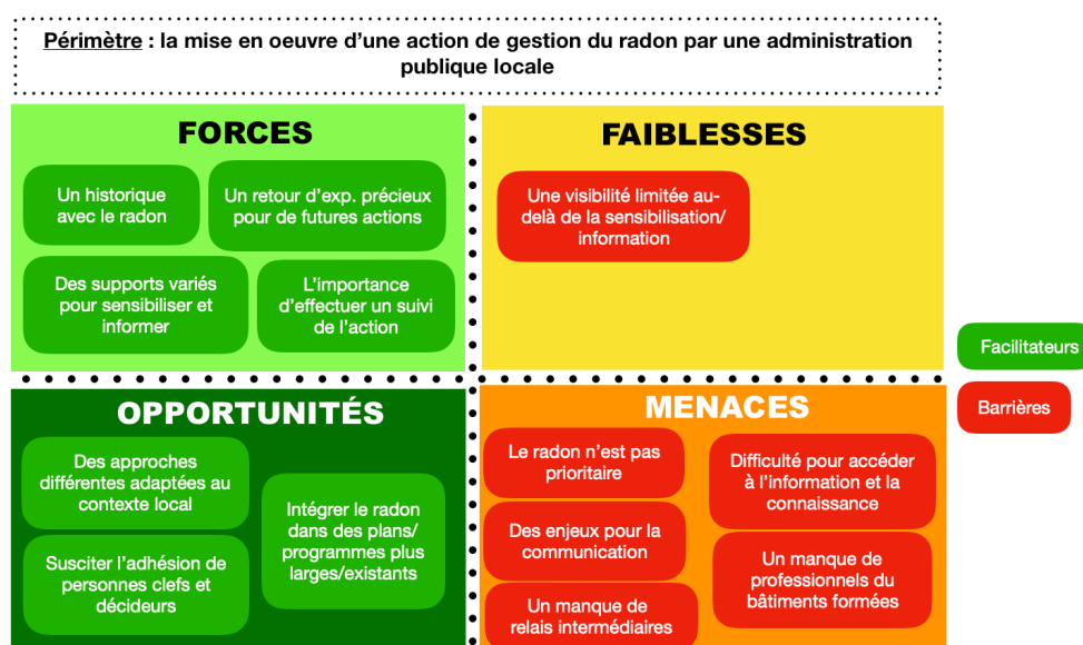
Figure 2. Analyse SWOT des barrières et facilitateurs identifiés chez les administrations publiques locales.

L'analyse SWOT (Strength Weakness Opportunity Threat, Force Faiblesse Opportunité Menace en français) est un outil classique pour évaluer le positionnement stratégique d'une organisation, d'un produit ou d'un projet. Les barrières et facilitateurs identifiés au §3 ont été classés dans une matrice SWOT et les résultats sont présentés sur la Figure 2 et la Figure 3.